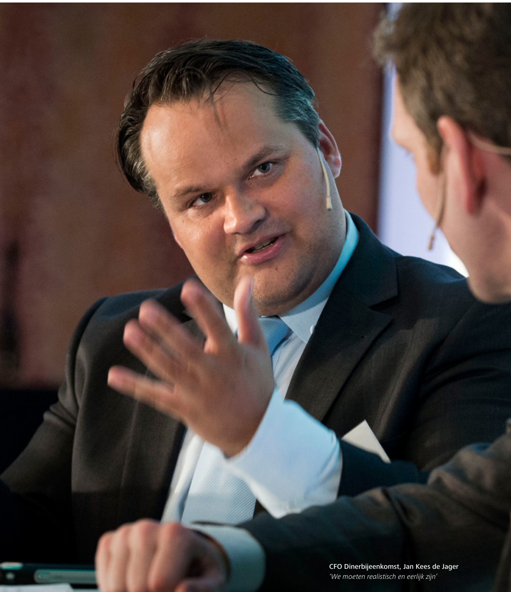
CFO Dinerbijeenkomst, Jan Kees de Jager 'We moeten realistisch en eerlijk zijn'